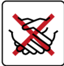
Hände schütteln vermeiden