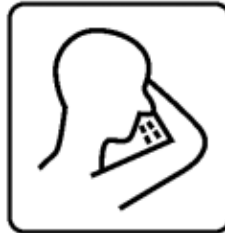
In Armbeuge husten und niesen